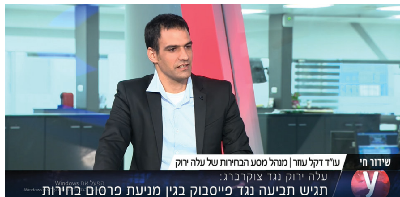
הקליניקה ייצגה את מפלגת עלה ירוק מול פייסבוק ושחררה את החסימה שהוצבה על הדובר שלה.

"תמיד היה שיח שנאה. אלא שהתפתחותן של רשתות חברתיות כפלטפורמות להבעה עצמית הביאה לתופעה בשם Online Disinhibition Effect. בעצם, היושב מאחורי המקלדת נמצא באזור דמדומים בין פרטיות לציבוריות. יכולתו לשמור על סודיות זהותו מאפשרת לו להתבטא בצורה שלא היה מתבטא בה בעולם האמיתי. הפלטפורמות האלו