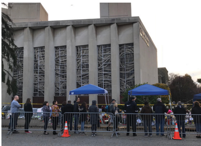
רצף פשעי שנהא מלוויים בתיעוד אינטרנטי. חזית בית הכנסת בפיטסבורג שבו אירע הפיגוע